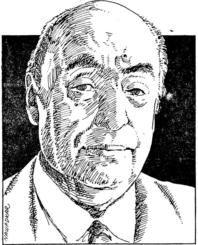
जनसामान्यांच्या हृदयात विराजमान झालेला महाकवी

या काळात नॅन्सी कनार्ड या मनस्वी कलावतीच्या ने संपर्कात आले. नॅन्सीच्या घरातच एक छापखाना होता. पॅलोंनी