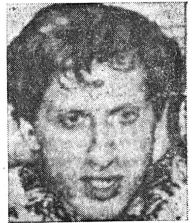
बॉबी फिशर त्यानं दंतकथा निर्माण केल्या

पसाडेना ही अमेरिकेतील लोकांना माहीत असलेली फिशरची जनसंपर्कापासून दूर रहाण्याची जागा आहे. काही वर्षांपूर्वी जेव्हा येथे बुद्धिबळस्पर्धा चालू होती तेव्हा मात्र एका बुद्धिबळ खेळाडूने बॉबीला बरोबर ओळखले. स्पर्धेनजीकच्याच एका कॉफीशाॅप-मध्ये फिशर लोकांना अजिबात ओळखता येणार नाही अशा पायघोळ कोट, काळा चप्पा, दाढी व डोळ्यांवर ओढलेली हॅट या वेषात बसलेला होता. स्मिमित झालेल्या चाहत्याने जेव्हा बॉबीला गाठण्याचा प्रयत्न केला तेव्हा तत्क्षणी बॉबीने तेथून पलायन केले. अशा शपथेवर सांगितल्या जाणाऱ्या कथा मुळीच अशक्य नाहीत; परंतु ह्याही-पेक्षा सुरस व चित्रविचित्र वैचित्र्यपूर्ण फिशर-कथा ऐकविण्यात येतात. त्याचे जवळचे मित्र व माहितगार असे सांगतात की, त्याची जीवनपद्धति चमत्कारिक जरूर आहे.