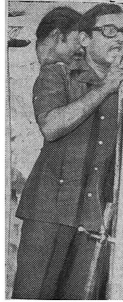
एस्. बी. ओव्हळ

मला माझ्या गावातील एका गरीब हिंदू स्त्रीची आठवण झाली. ७२ चा भयानक दुष्काळ. दोन मुले असलेल्या या बाईचा नवरा आजारी पडला. बाईनं होतं नव्हतं ते विकून टाकलं; पण त्याचा