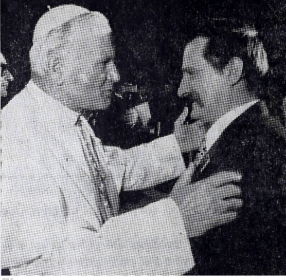
पोप जॉन पॉल - मी तुमच्या पाठीशी आहे !