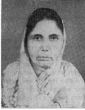
नेहमी आघाडीवर असलेल्या...माताजी