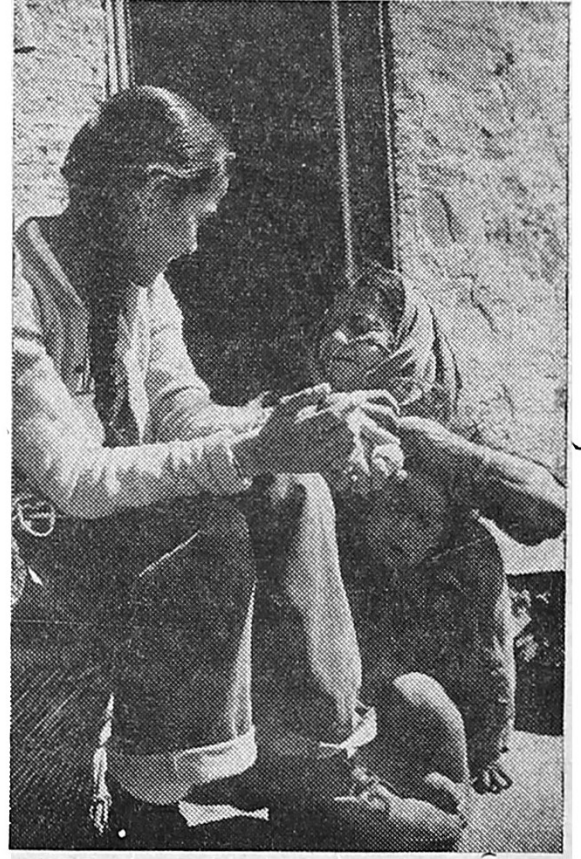
पोरीपासून महातारीपर्यंत सर्वांची मंत्रोण - अंदलीदेवी

(२) भागीरथीनदीच्या पात्रातील अनेक खडकांमध्ये ओपन जॉइंटस्-भूदोष असलेले पट्टे आहेत. त्यामुळे मोठ्या प्रमाणावर पाणी क्षिरपून धरणाला धोका उत्पन्न होईल.