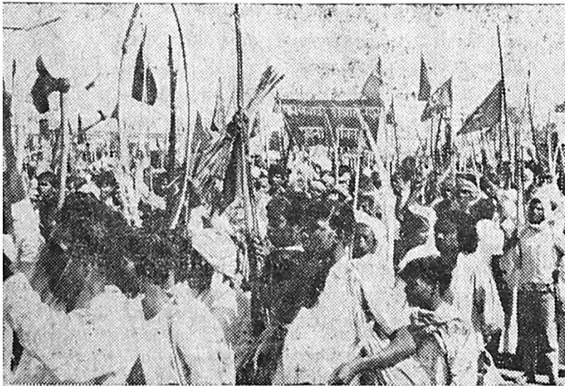
प्रत्येक बारा माणसांमागे एक माणूस शस्त्रधारी असतो,

वापर करून वारेमाप पैसा मिळवतात. नोकरीच्या शोधात असलेल्या गरजू मंडळींना नोकऱ्या चक्क विकल्या जातात ! मंत्र्यांच्या बंगल्यांतून बेकायदेशीर असलेल्या दारूविक्रीचा व्यवसाय चालतो. आमदारमंडळी सतत हत्यारबंद असतात. नोंदलेल्या गुन्हेगारांना आणि डाकूंना चक्क राजाश्रय लाभलेला दिसतो. एका पोलीसअधिकाऱ्यानेच असे सांगितले की, वरिष्ठ पोलीस अधिकाऱ्याने काही लाख रुपये खर्च केले तर त्याला खातेप्रमुखाची सर्वोच्च जागा मिळू शकते आणि एकदा ही जागा हाती आली की, ती मिळण्यासाठी खर्ची टाकलेली सर्व रक्कम व्याजामुद्धा मिळू शकते. अन्यायाविरुद्ध थोडा-फार आवाज उठवला तरी असा आवाज उठवणाऱ्यांना नक्षलवादी ठरवून गोळ्या घालण्यात येतात. सरकारला आणि धनवंतांना नको असलेल्या मंडळींना तुऱंगात डांबण्यात येते आणि त्यांना वर्षानुवर्षे तुऱंगातच खितपत पडावे लागते. निवडणुकीमधील यश हे जनतेची मान्यता मानून मुख्यमंत्री उच्च न्यायालयाचे आदेश झुगारून देऊन स्वतःविरुद्धचे खटले मागे घेतात. आजच्या बिहारमधील ही परिस्थिती अस्वस्थ करणारी असून वेळीच हालचाल झाली नाही तर सध्या अशांत असलेल्या या राज्यावर गुंडांचे परिपूर्ण स्वामित्व प्रस्थापित होईल ! बिहारमधील विचारवंतांना, पत्रकारांना, सामाजिक कार्यकर्त्यांना आपले राज्य विनाशाच्या काठावर उभे आहे याची पूर्ण जाणीव आहे. बिहारमध्ये कोणी नव्याने गेले तर पाटण्यामधील पत्रकार या नरकामध्ये आपले स्वागत असो अशा शब्दात पाहुण्यांचे स्वागत करतात. बिहारमध्ये गुन्हेगारीच्या