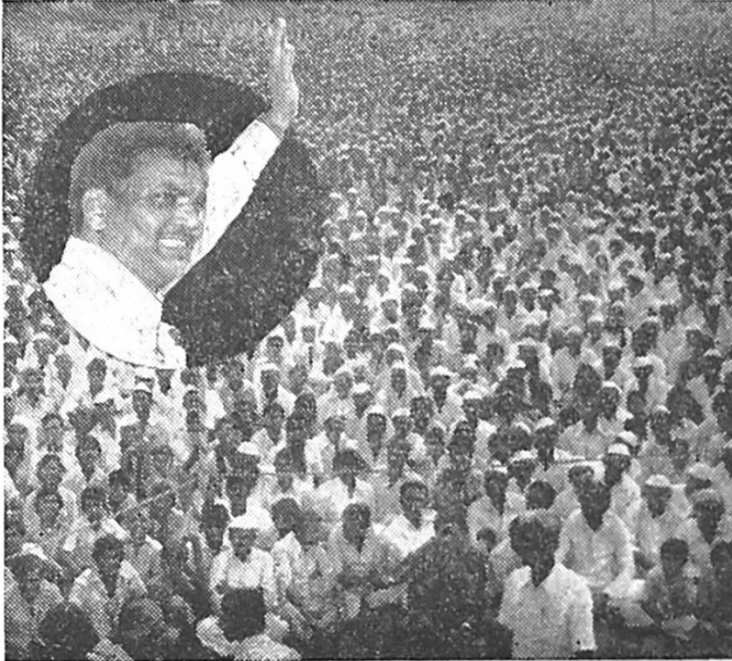
सटाणा अधिवेशन वृत्तान्त ...पृष्ठ १०