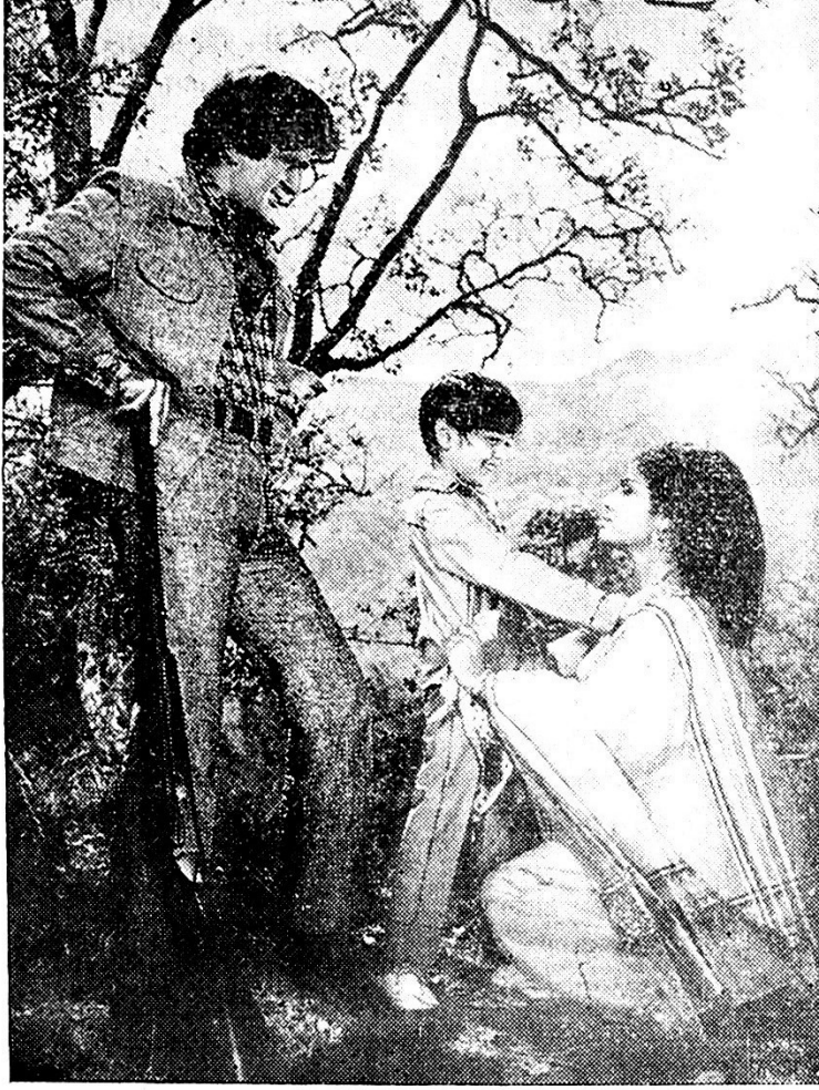
शशी-राखी-मा. अलंकार – जानवर और इन्सान मध्ये. राखी मा. अलंकारला शशीसारखा दणदणीत हीरो हो म्हणून सांगत्ये.