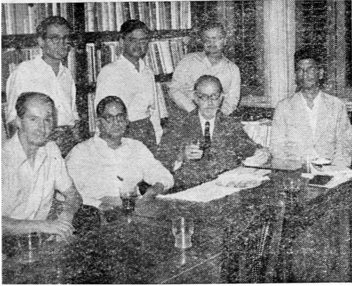
सर स्टॅनले अन्विन यांची पॉप्युलर भेट । १९४८