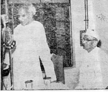
पॉप्युलर प्रकाशनचे उद्घाटन

कधी विचारले नव्हते त्यांकडे मन वळू लागले.