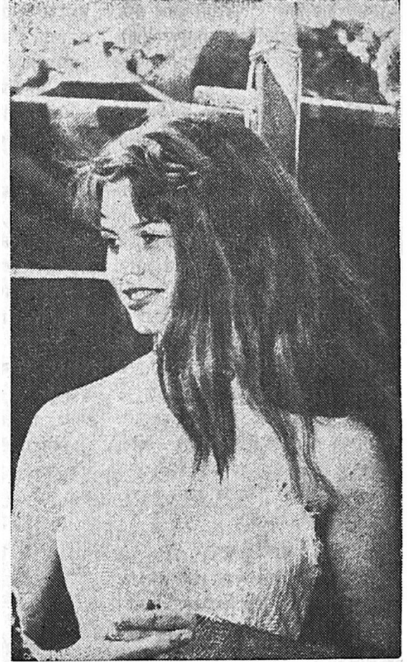
ब्रिजिट बादो- आदर्श सौंदर्य

लग्नानंतर ब्रिजिटने काही फ्रेंच चित्रपट पूर्ण केले. त्यामध्ये 'अॅक्ट आफ लव्ह' नावाचा एक चित्रपट होता. यावेळी प्रसिद्ध अमेरिकन नट कर्क डग्लस याच्याशी तिची मुलाखत झाली. त्यामुळे कॅनिस चित्रपट