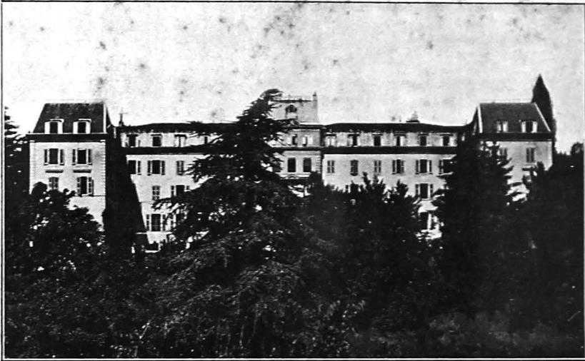
Das gegenwärtige Gebäude des Internationalen Arbeitsamts.