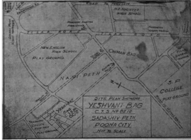
यशवंत बागेतील १९ प्लॉटसचा नकाशा

१२ प्लॉटस गांवठाणांतील व त्यांना लागून ७ प्लॉटस टी. पी. स्कीममधील. यशवंत बागेची मार्गदर्शिका