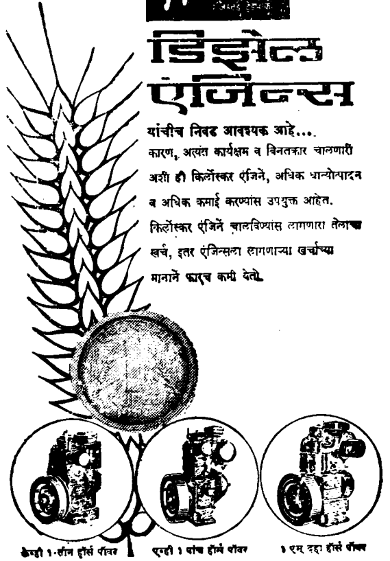
केप्टी १-टीन हॉर्स पॉवर

यांचीच निवड आवश्यक आहे.... कारण, अत्यंत कार्यक्षम व निनतकार चालणारी अशी ही किलोस्कर एंजिने, अधिक धान्योत्पादन व अधिक कमाई करण्यास उपयुक्त आहेत. किलोस्कर एंजिने बालविष्यांस लागणारा तेलाचा खर्च, इतर एंजिन्सला लागणाऱ्या खर्चाच्या मानाने खालच कमी देते.