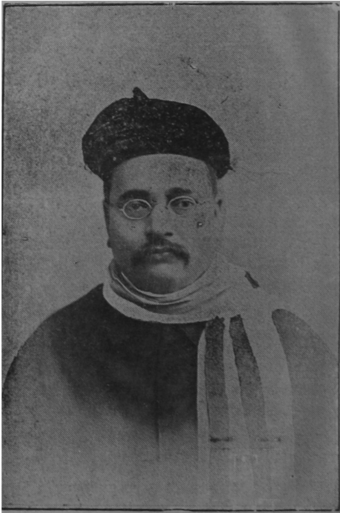
भारतसेवक ना. गोपाळ कृष्ण गोखले.