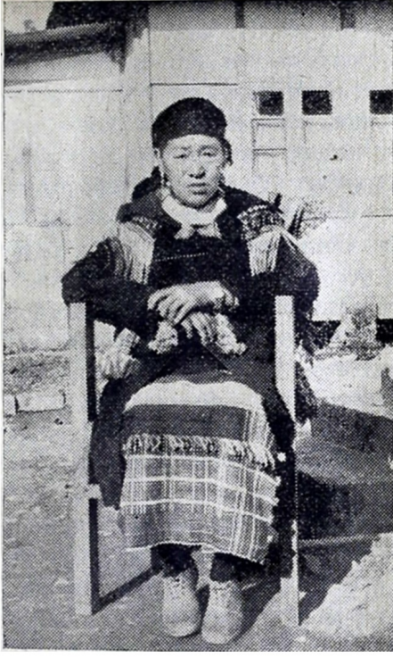
राणी माँ - आज हताश !