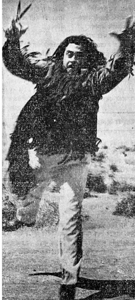
बढती दाढीमागे कात्री घेऊन लागलेला किशोर

हां तर कॉमेडीविषयी. 'दुनिया का मेला' तुम्ही कोणी पाहिलंत. चालींच्या भूमिकेत