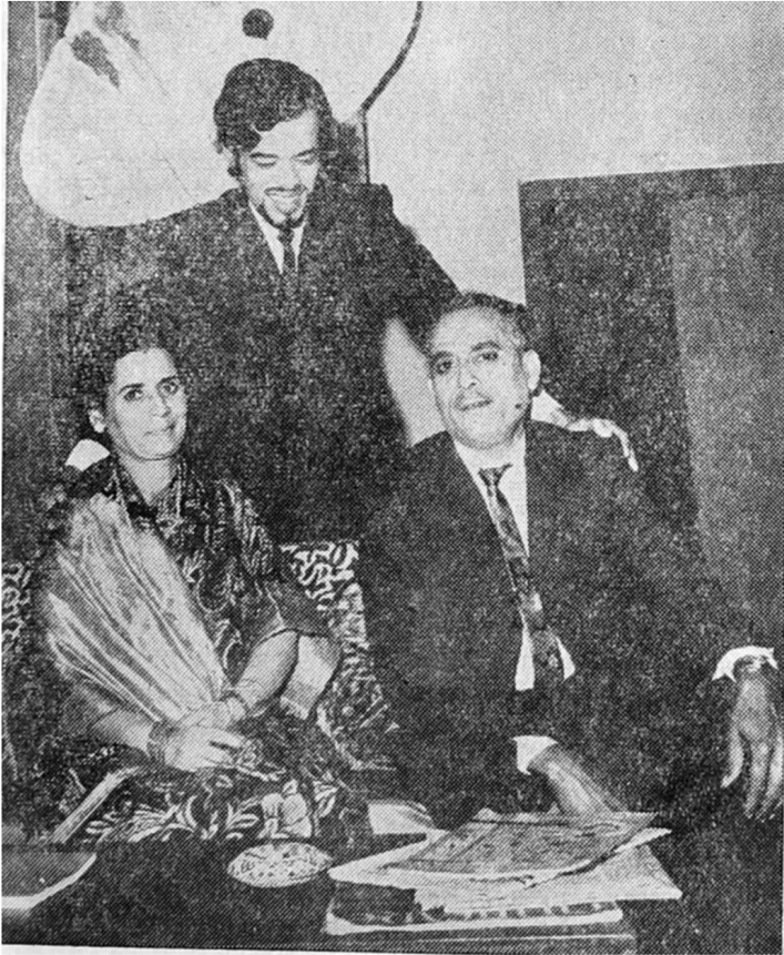
'अभिवादन'चे 'दश' अतिरंजित, भडक

कारण दारव्हेकरांना मूळ नाटकातील कथावस्तूच्या पोताचा विचार न करता अनुवाद करण्याची सवय आहे. (उदा. 'नयन तुझे जादूगार') काव्यात्मक कथावस्तूला दारव्हेकरांची उपकथा-