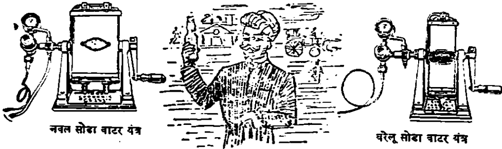
नवल सोडा वाटर यंत्र

यंत्रों और कलपुर्जोंकी नकल से सावधान रहिये