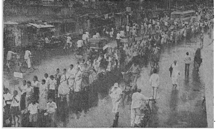
पोलीसखात्याच्या निषेधार्थ इचलकरंजीच्या महिलांचा मोर्चा