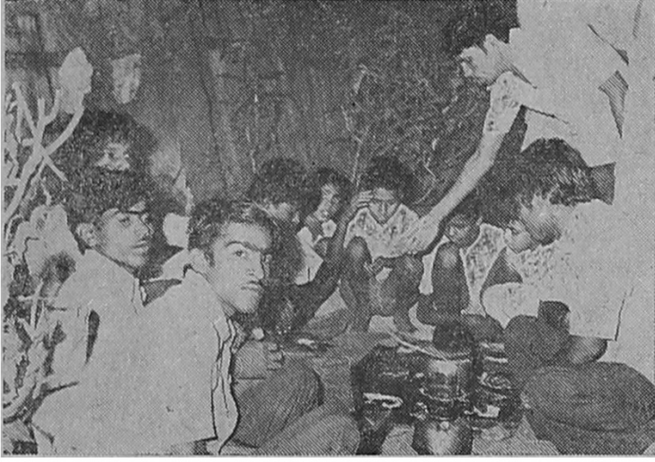
इचलकरंजी-शहरात भर रस्त्यावर चालणारा तीन पानी जुगार