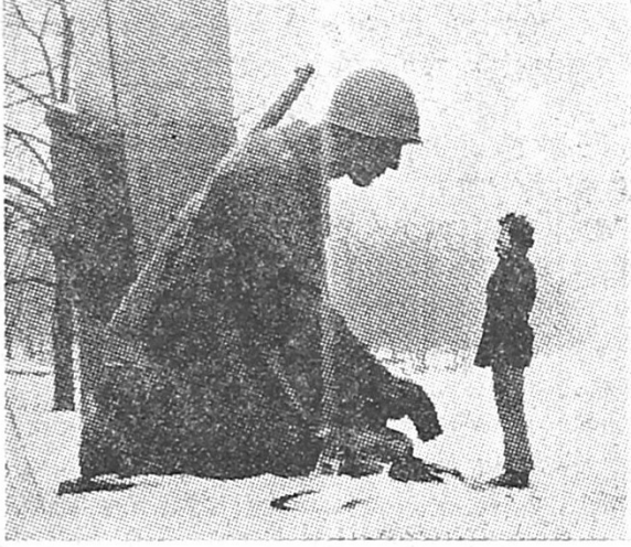
वालेसा-दुसऱ्या महायुद्धातील हुतात्मा पोलिश सैनिकांच्या स्मारकाला अभिवादन करताना