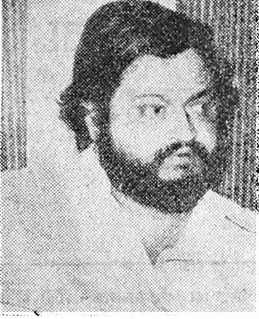
दोन बलदंड वृत्तपत्रांचे सामर्थ्य

प्रश्न : या बिलाविरुद्ध बिहारमध्ये व अन्यत्र एवढा मोठा आगडोंब उसळला असताना राष्ट्रपती या बिलाला संमती देतील का ?