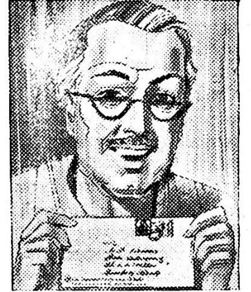
वीस वर्षानंतर पुन्हां पेसे परत