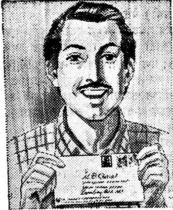
पंच वर्षानंतर पेसे परत