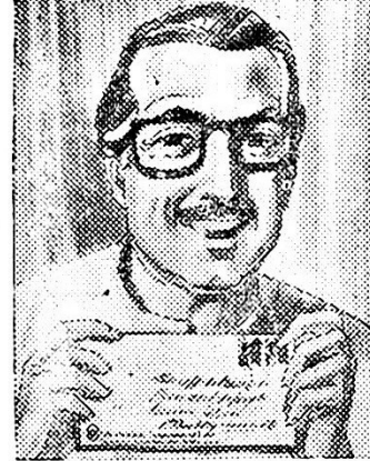
पंधरा वर्षानंतर पुन्हां पेसे परत