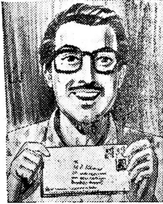
दहा वर्षानंतर पुन्हां पेसे परत.