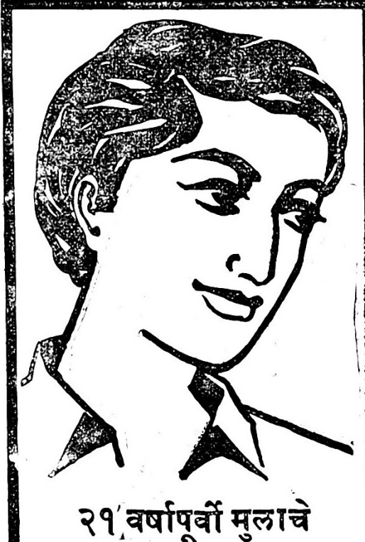
२१ वर्षापूर्वी मुलाचे