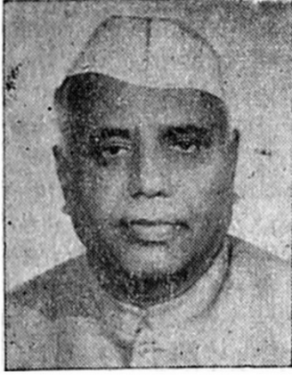
खा. यशवंतराव चव्हाण