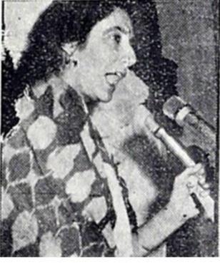
खा. अंबिका सोनी

कुरळे केस, चेहऱ्यावर प्रसन्न हास्य. उजवा हात आशीर्वादासाठी उचललेला. बाकी या संत-महंतांचं बरं असतं. राजकीय नेत्यांपासून शत्रुघ्न सिन्हासारख्या सिनेनटापर्यंत सर्वत्र यांचा 'सोने-नाणे आम्हा मूर्तिकेसमान' असं म्हणत मुक्त संचार असतो. महाराष्ट्राचे माजी मुख्यमंत्री शंकरराव चव्हाण यांच्याकडे गेलो. तिथेही 'फायर हाउस' च्या वरच्या कठड्यावर शंकररावांचा सत्य साईबाबांसमवेत काढलेला फोटो होताच.