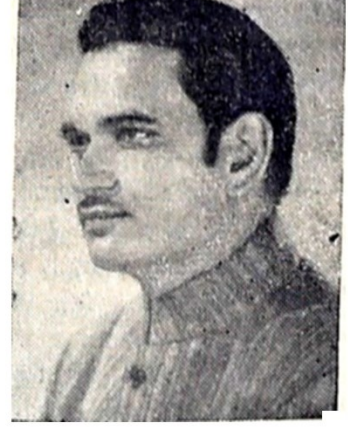
खा. शिवराज पाटील

‘देशापुढील आसामच्या प्रश्नासारख्या समस्या सोडवताना सर्वच राजकीय पक्षांनी हे लक्षात घेतलं पाहिजे की, अशा नाजूक प्रश्नांची उकल करताना लोकांची मनं हळू-हळू तयार करावी लागतील व मगच ते प्रश्न सोडवता येतील. तेव्हा अशा वेळी सर्व