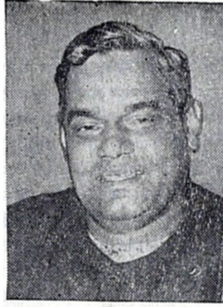
खा. अटलविहारी वाजपेयी