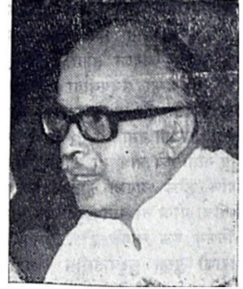
श्री. लालकृष्ण अडवानी