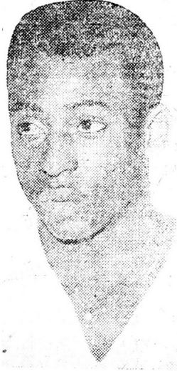
एडसन अवान्टेस नस्किमेन्टो

रिओ-डी-जानोरी येथे भरविण्यात आलेल्या इन्व्हेंटेशन टूर्नामेंटमध्ये इंग्लंड विरुद्ध ब्राझील या सामन्यात तर पेलेने कमाल केली. पहिल्या अर्ध्या खेळात कोणीच कोणावर गोल करू शकले नाहीत. विश्रांतीनंतर खेळ सुरू झाला. दोन्ही संघांनी आता आक्रमक पवित्रे घेतले होते, तरीदेखील गोल होण्याची चिन्हे दिसेनात. दोन तुल्यबल संघांतील ही लढत अखेर वरोवरीने सुटणार असे वाटू लागले. इतक्यात पेले ब्राझीलच्या मदतीला धावून आला. त्याने अवघ्या आठ मिनिटांत लागोपाठ तीन गोल मारून विजयश्री खेचून आणली आणि प्रेक्षक पेलेला डोक्यावर घेऊन अक्षरशः नाचले.