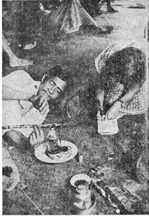
ब्रह्मी अफिमाची मुलाखत

झोपडी अशा ठिकाणी बांबली होती की तिथून पडते पाणी अगदी जवळून दिसावे. पडणारा घो घो प्रवाह पाहत चांगले जेवण होणार या कल्पनेत दोघी होत्या. परंतु ताटात जे पदार्थ पुढे आले ते पाहून दोघींच्या पोटात ढवळू लागले. घबघव्याच्या वेगाने पोटातील पाणी तोंडावाटे बाहेर येऊ लागणारसे त्यांना वाटू लागले. तळलेल्या मोठ्या मुंग्या, कावळ्याच्या छत्र्या असलेले पदार्थ त्यांनी कधी खाल्ले नव्हते.