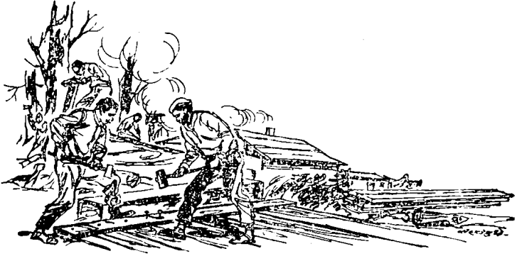
जिवापाड मेहनतीनं आमचा कारखाना उभा झाला.

दिहांगला मिळालेली उपनदी आमच्या कारखान्याजवळून जात होती. आमच्या भागात आम्हीदेखील कंपनीसाठी तराफे बनविण्यास मुरुवात केली. फेब्रुवारीचा संपूर्ण महिना आमचे हे निर्माण कार्य चालू होते.