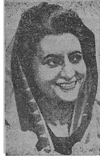
'होय - लोकांच्या पाठिंब्यावरच मी परत येईन !'

१९६९ नंतरचा घटनाप्रवाह अशा रीतीने न्याहाळला तर इंदिरा गांधी या शक्तीची अखेर अशीच होणे क्रमप्राप्त होते; दुसरे काही