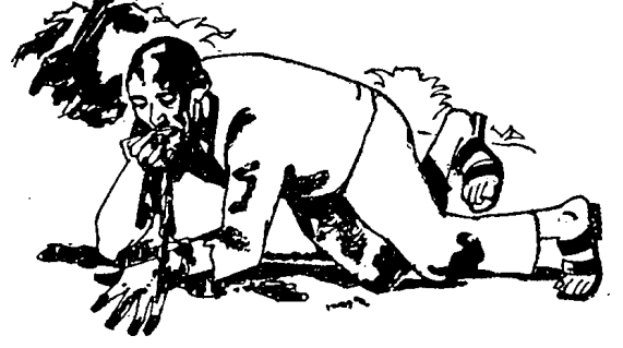
घराच्या अंगणातच रक्ताची गुळणी ओकून त्यानं प्राण सोडला.

पण शांतता झाल्यावर मू पुन्हा झॅमला घेऊन गावी आला होता. आता झॅम गो दिन दिएमच्या सैन्यात सेकंड लेफ्टनंट झाला होता. मूनं पुन्हा सान्या जमिनी बळकावल्या, पुन्हा घर बांधलं. वर्षांनु-वर्षांचा त्याचा क्रांतिकारकांविरोधचा द्वेष आता उफाळून आला