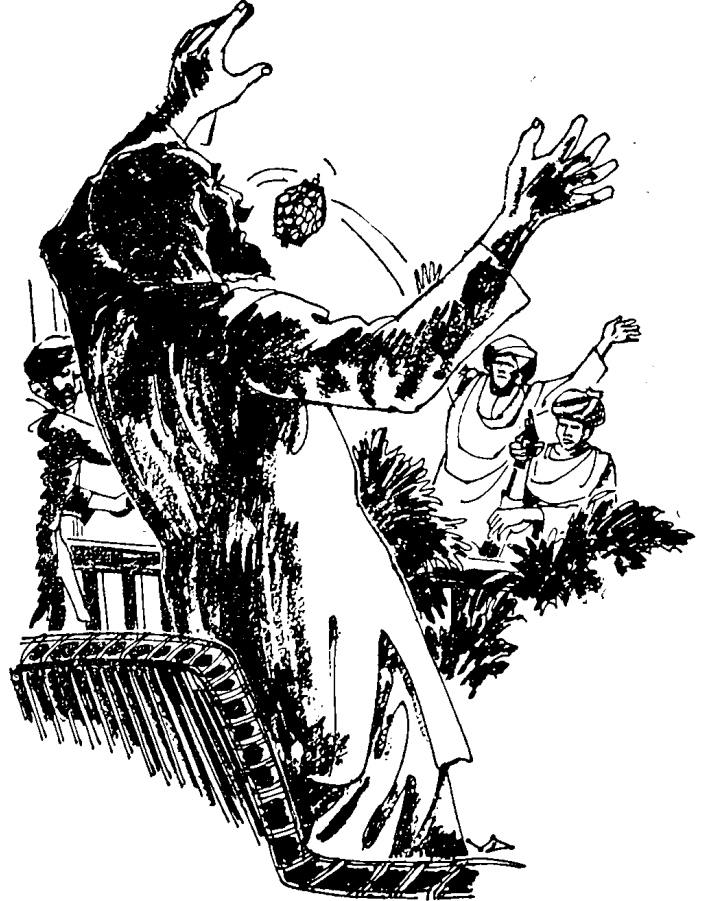
मेढेकरांनी दोन हँडग्रेनेडस् बद्रोहीनच्या दिशेने फेकले

निसर्ग चित्रकाराने हळूवार हाताने काळ्या रंगाच्या फराट्या त्या रंगावर मारावयास प्रारंभ केला होता. गावाच्या बाहेरून गोधन नुकतेच परतले होते. पक्षीगण घरट्याकडे परतत होते. रस्त्यावरून उडालेला धुरळा अजून जागी विसावला नव्हता. अंधारत आलेल्या गावात धुरळ्यामुळे जास्त अंधारून आल्यासारखे वाटत होते. घराझोपड्यांतून चुली पेटल्या होत्या. पेटल्या लाकडाचा धूर गावात सर्वत्र भरून राहिला होता. अंधार, धुरळा आणि धूर यांचा अजब मिलाफ अंधक प्रकाशात दाटला होता. मुले-माणसे चुलीभोवती एकत्र झाली होती. त्या दिवशी १४ डिसेंबर १९४७ ची अमावास्या होती. हवेत चांगलाच गारवा जाणवत होता. ही मुले 'बोरी' जवळ आली तेव्हा संध्याकाळचे सहा-साडेसहा झाले होते. हिवाळ्यामुळे दिवस लवकर मालवला होता. गाव चांगलेच अंधारात असल्यामारखे दिसत होते. मुले