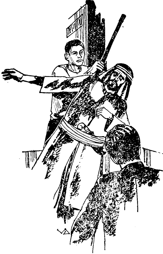
त्याच क्षणी मी त्याच्या मानेवर फटका मारला.

प्रमाणे मॅच्युरेटन अरबाबरोबर रात्री अकराची वेळ ठरवली.