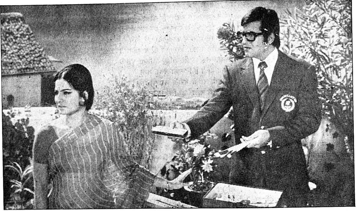
मॅनली विनोद खन्नाबरोबर काम करायला तिला आवडते. ' इम्तिहान 'मध्ये विनोदबरोबरच.