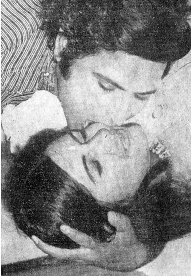
डिंपल - वितु स्टार्ईलने एकमेकावर मरणारी 'आलिगन'ची जोडी रोमेश शर्मा - जाहिरा