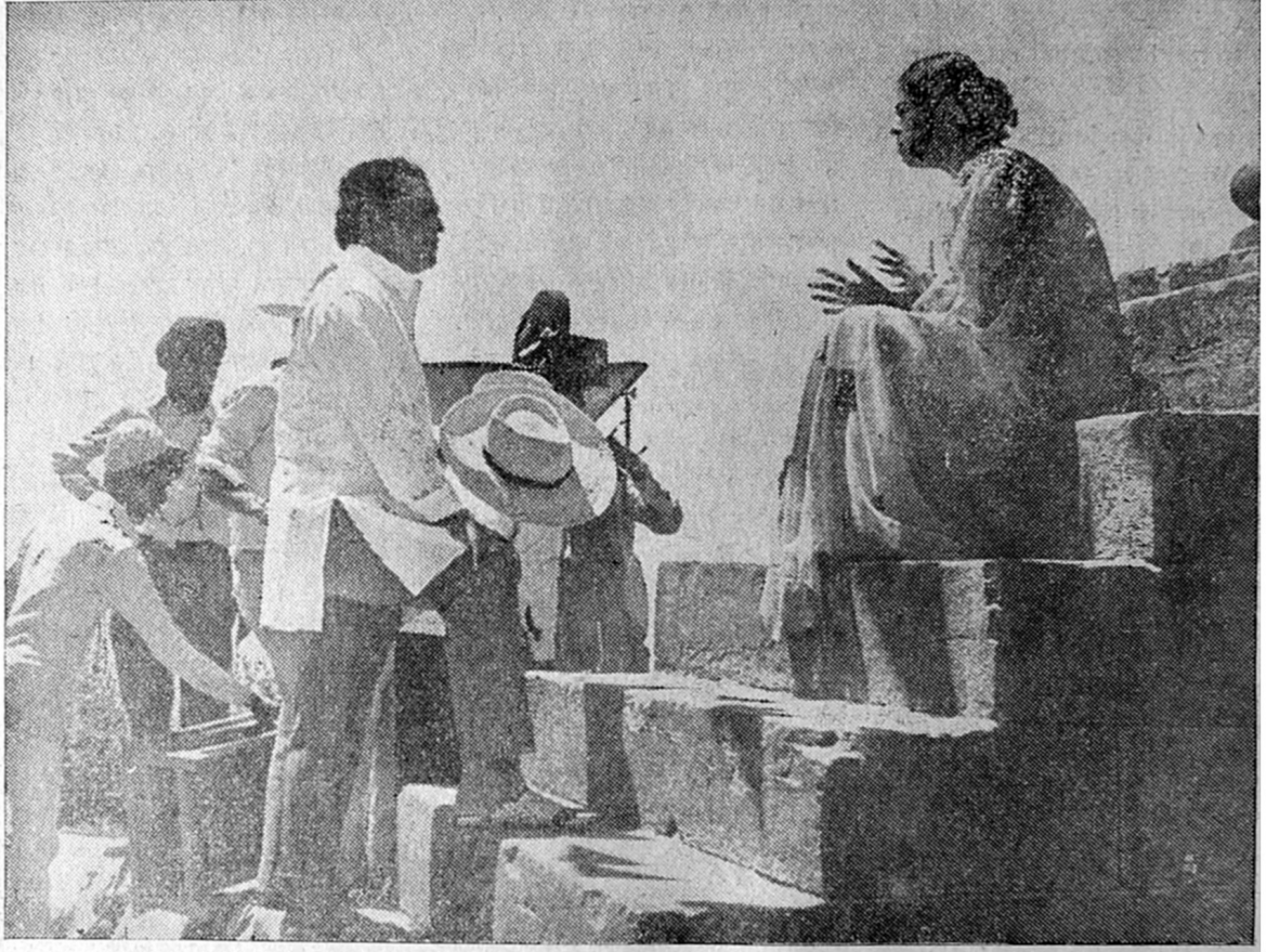
‘आ’कारान्तवाले ओमप्रकाश ‘आपकी कसम’च्या वेळी मुमताजबरोबर