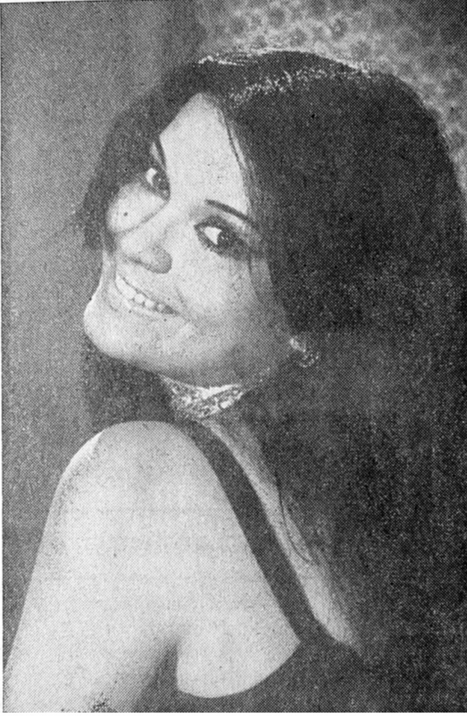
झीनी अ परफेक्ट मॉडर्न गर्ल...

अद्याप लहान मराठी नाटकात चालणाऱ्या फ्लॉवरी चेहऱ्याच्या बालनटीचा चेहरा घेऊन ती आली होती. तिच्या उंचीमुळे ती भारदस्त 'सूर्यफुला' सारखी वाटत होती. आमच्या पत्रकार मित्रांनी तिला नामंजूर केली. आम्ही हेमा आणि नूतनखेरीज कुठल्याही अभिनेत्रीला हिरॉइन म्हणून पास करत नसू. आम्हाला मीनाकुमारी चालते हे ठीक आहे. पण जाहिदा, किंवा झीनत मात्र पसंत नव्हती.