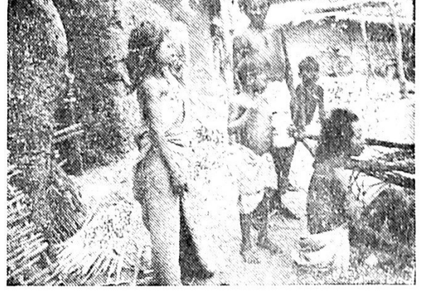
दोन-तीन दिवस उपाशी राहायचं, एक-दोन दिवस खायचं

इतर स्वयंसेवी संस्थांकी कळाहांडी आदिवासी संघ, ग्रामीण विकास संस्था वगैरे आहेत. मात्र पतप्रदानांपासून तहत कलेक्टरांपर्यंत सर्वांना निवेदन पाठविण्याशिवाय आदिवासी संघाचं दुसरं कोणतंच काम नाही. गेल्या पाच वर्षांत दोन आदिवासी मेळावे घेतले. त्यांनी पाठवलेल्या काही सविस्तर निवेदनांमध्ये दारूची बाधा टाळण्यासाठी उपाय, शिक्षण, आरोग्य, दळणवळण-वाहतूक यांची