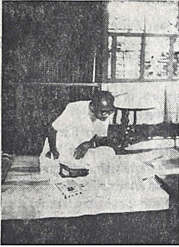
जर या भागात काही चांगलं करायचं असेल तर पुढच्याच पिढीचा विचार करायला पाहिजे-काणे

विचार करण्याची, आमच्याशी जगडण्याची त्यांना गरजच नव्हती. अगदी मच्छर हातो आम्ही त्यांच्यापुढं.