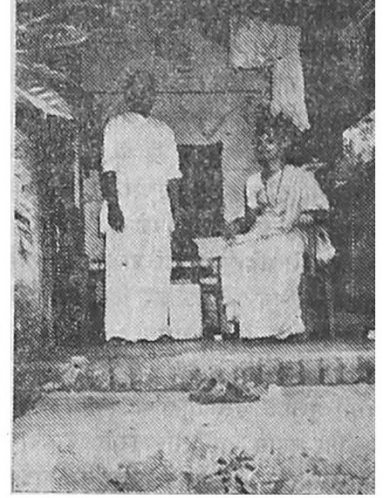
दोघांची जीवनभृत्ये, जगण्याचा ध्यास एकच !

मुले तशी प्रामाणिक, कष्टाळू, इतर कोणत्या बाबतीत चोकशी केली असती तर ती रागावली नसती. पण 'जेवण' म्हणजे इथल्या या मुलांच्या जीवनात फार नाजूक जागा. मी त्यांच्या मर्मावरच आघात केला होता. म्हणून मुले दुखावली. नंतर मला हे स्पष्ट झाले. मी ठरविले. शक्यतो अशी वेळच येवू द्यायची नाही आणि जेवण्या-खाण्यावरून मुलांना काही बोलायचे नाही.