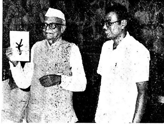
'मुंबईत सिद्धीविनायकापुढे लागणाऱ्या रांगा मला अस्वस्थ करतात, अंतर्मुख करतात' - डॉ. दामोळकर

'या विषयावर भरपूर वादविवाद होण्याची शक्यता आहे याची कल्पना असुनही मी या पुस्तकाचे लेखन केले. यामुळे लगेच समाजपरिवर्तन होणार नाही. ही तेवढी सोपी गोष्ट नाही याची मला पूर्ण जाणीव आहे; पण या पुस्तकाचा परिणाम म्हणून अंधश्रद्धेला विरोधी लढा देणारी काही माणसे तरी पुढे येतील असा मला विश्वास वाटतो. अर्थात अशा कार्यकर्त्यांप्रमाणेच अंध-श्रद्धेला बळी पडलेल्या लोकांनीही त्यातून बाहेर पडून आमच्यात सामील व्हावं हा आमचा या मागचा प्रमुख हेतू आहे.' असे पुस्तकाचे लेखक डॉ. नरेंद्र दामोळकर म्हणाले. या विषयाचा त्यांचा अभ्यास आणि अनुभव खूप व्यापक स्वरूपाचा असल्याने हे कार्य किती कठीण आहे, त्याचे परिणाम किती अल्प प्रमाणात होणे शक्य आहे हे ते जाणून आहेत. त्यांनी समाजात प्रचलित अंधश्रद्धांचे तीन विभाग पाडले-एक, अज्ञाना-तून आलेली अंधश्रद्धा. याच्याशी लढा देणे, त्यांना तुलनेने सोपे वाटते. कारण त्यापोटी आलेल्या समजुतीचे दृश्य परिणाम लगेच दिसतात. कुत्रा चावल्यावर चौदा इंजेक्शन न घेता इतर गोळ्या घेणे. साप चावल्यावर मांत्रिकाकडे नेणे, पोलिओ झालेल्या मुलाला उकिरड्यात पुरून ठेवणे यांचे अनिष्ट परिणाम माणसाला अंधश्रद्धेपासून दूर न्यायला मदतच करतात, असे त्यांना वाटते. महाराष्ट्रात या बाबतीत अगदी प्राथमिक स्तरा-वर का होईना पण चर्चा सुरू झाली आहे, असे सांगून डॉ. दामोळकर म्हणाले की, ही चर्चा, विचारांची देवाणघेवाण उघडपणे विस्तृत रूपात व्हावी. लोकांनी पुढे येऊन आम्हाला प्रश्न विचारावे असा आमचा