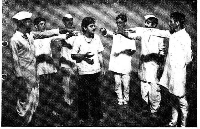
'फितूर तो चंद्र' मधील एक दृश्य.