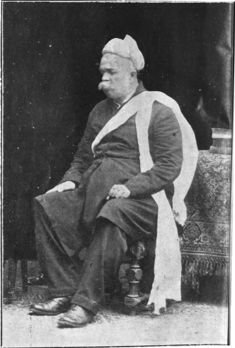
न्यायमूर्ति महादेव गोविंद रानडे.