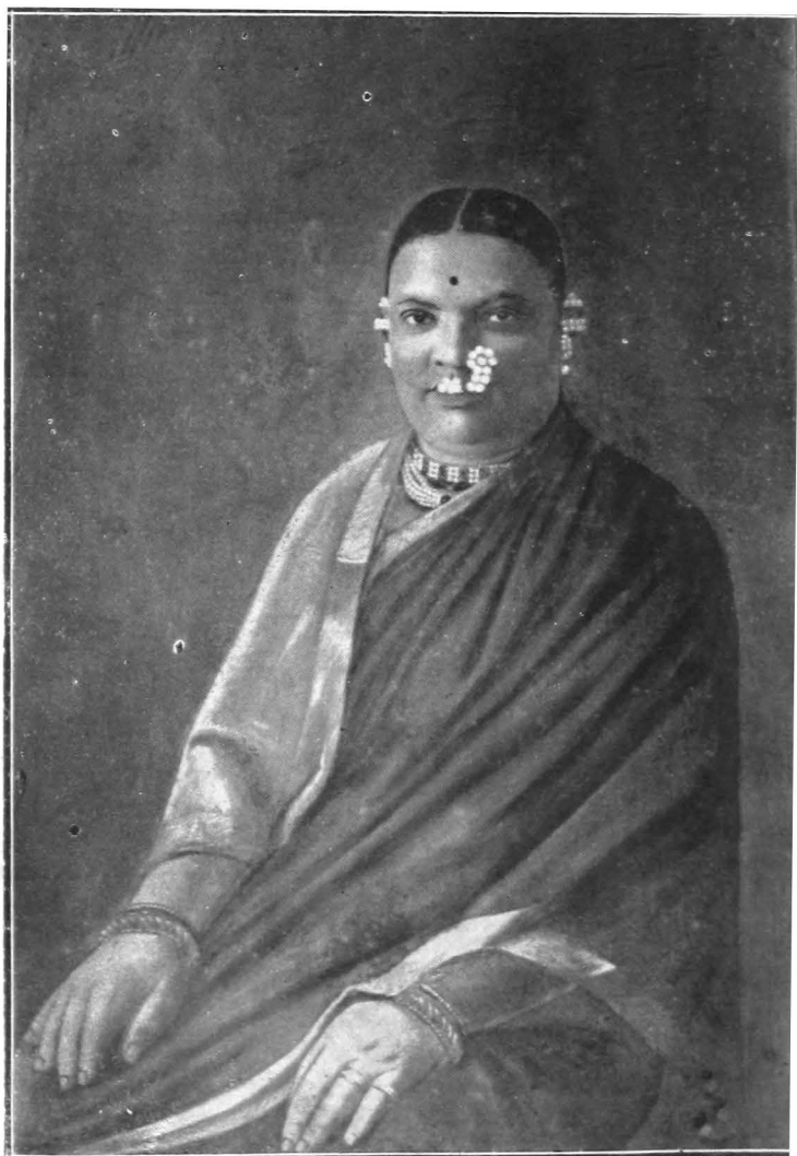
श्री. सौ. रमाबाई रानडे.