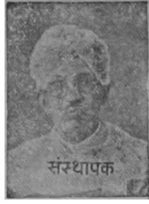
पो. वा. गो. काळे