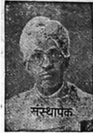
मा. वा. गो. काळे