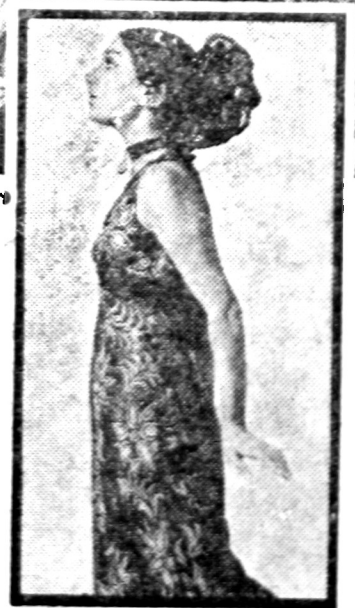
Modem TGM/1/ Mar

काऊन् • हिन्दुस्थान युनिट नं. १ • हिन्दुस्थान (राबिबन) युनिट नं. २ १९, कपोतो स्ट्रीट, मुंबई - १.