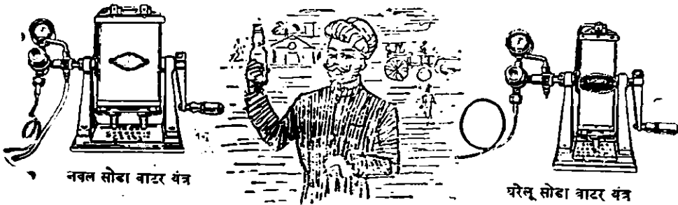
नवल सोडा वाटर यंत्र

यंत्रों और कलपुर्जोंकी नकल से सावधान रहिये