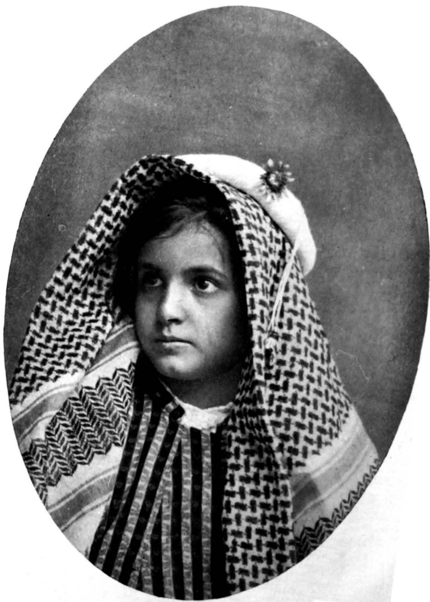
A little Baghdadi.